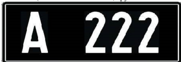
Тип A9. Регистрационный номер старинного транспортного средства и его прицепа. Тип шрифта:4.

Тип A9, с размерами 302x113 мм. Регистрационный номер используется для автомобилей (легковой автомобиль, грузовой автомобиль, автобус и т.д.).