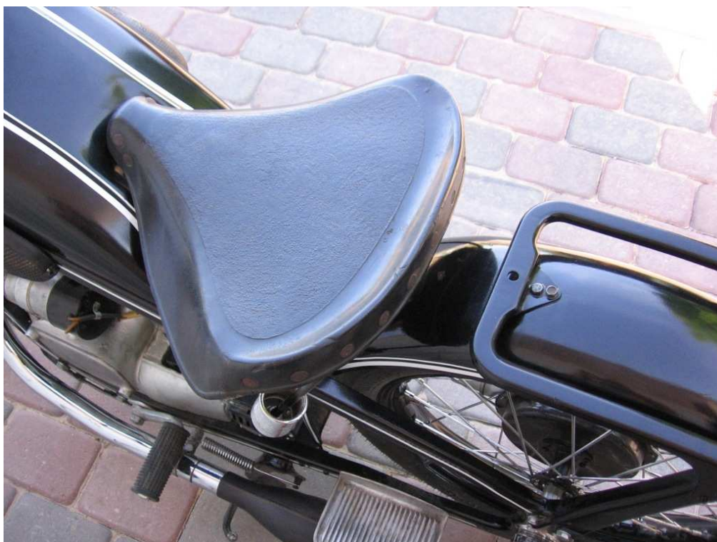
Vaade sõiduki istme(te)le