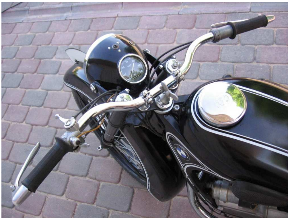
Vaade sõiduki juhtimisseadmetele