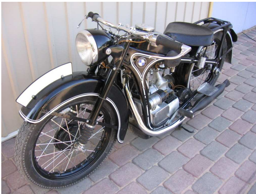
Diagonaalvaade esiosale ja vasakule küljele