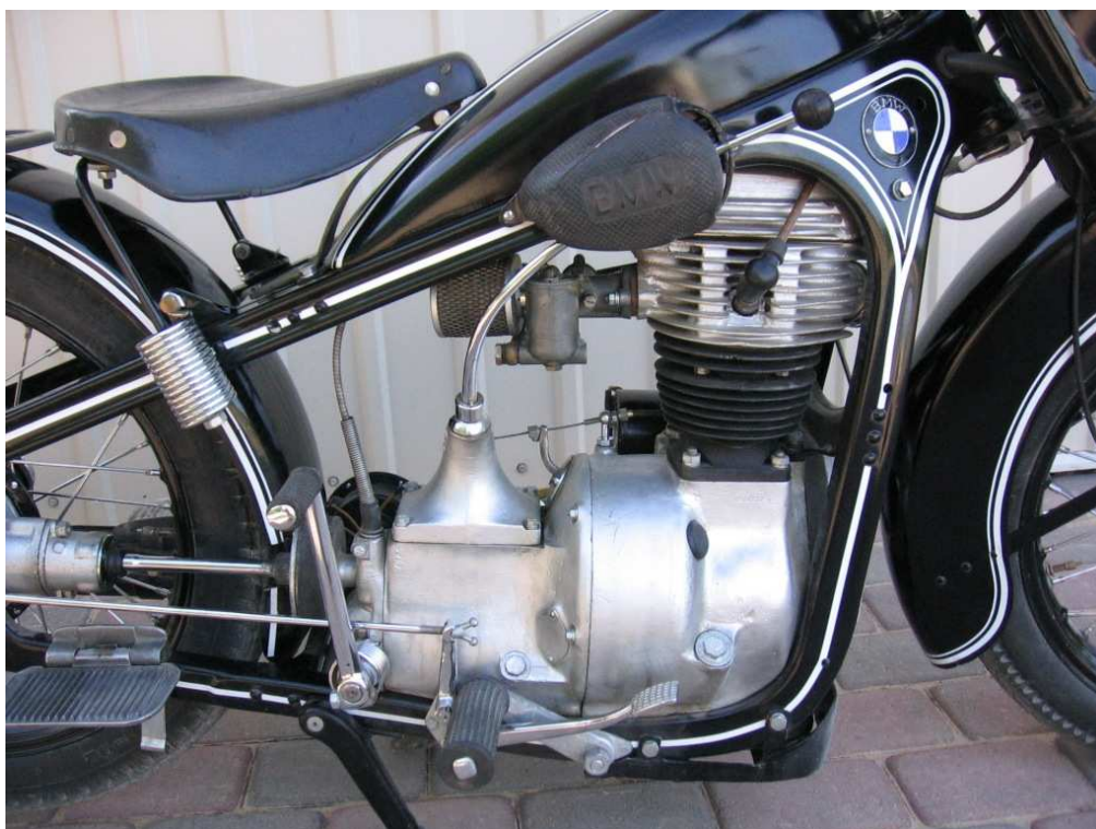
Vaade mootorile teiselt küljelt