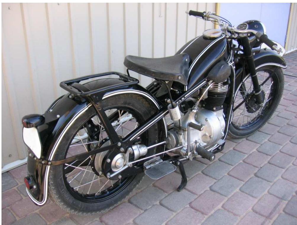
Diagonaalvaade tagaosale ja paremale küljele