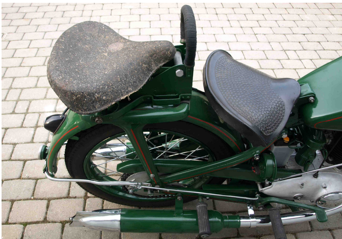
Vaade sõiduki istme(te)le