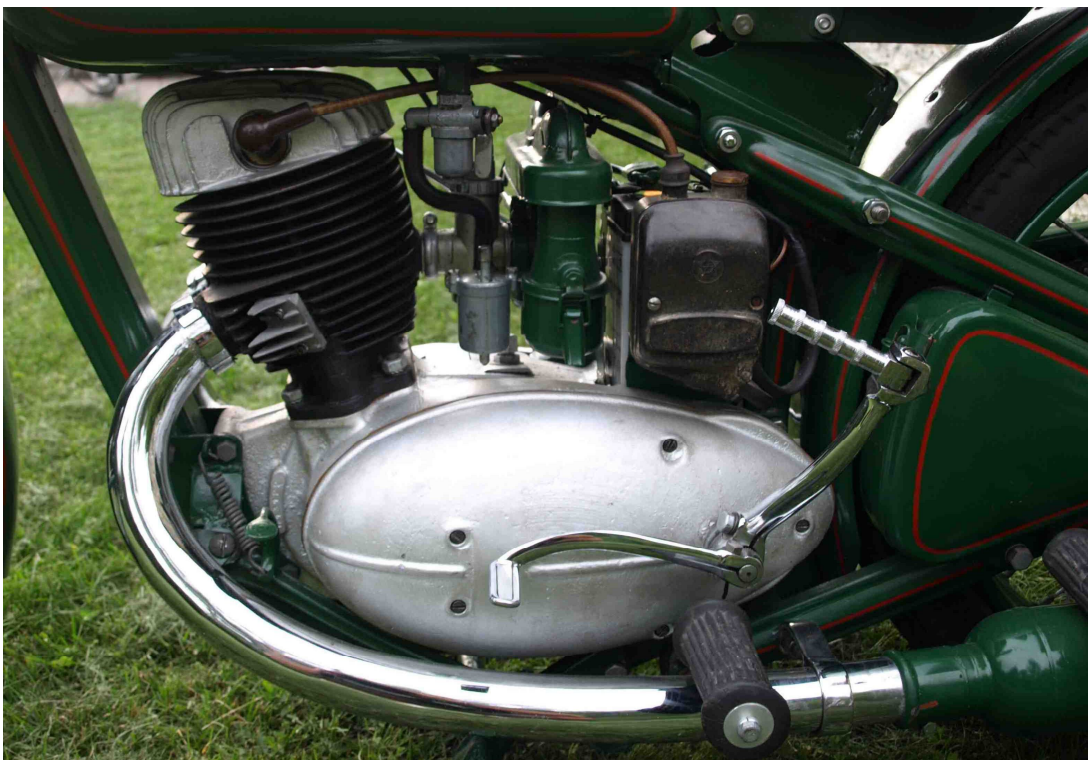
Vaade mootorile ühelt küljelt