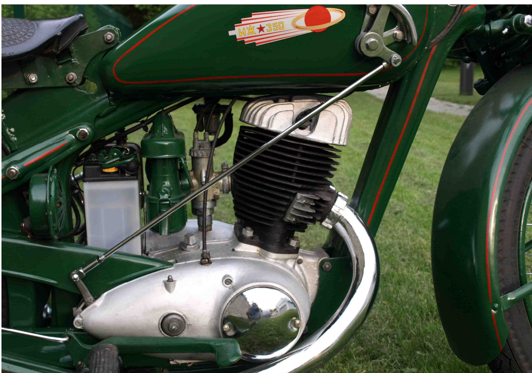
Vaade mootorile teiselt küljelt